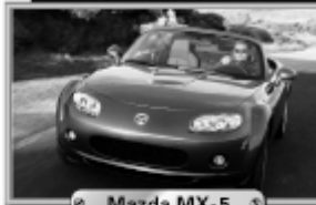
↔ Mazda MX-5 ↔

Testen Sie einen Tag lang Ihren Mazda-Favoriten!